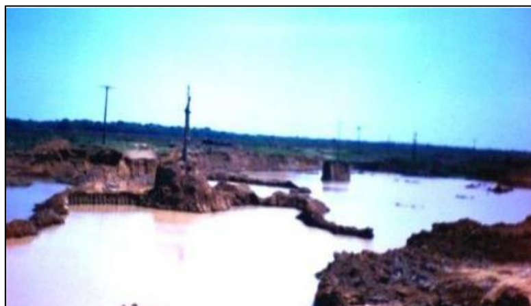
Figura 1 – Inundação das Olarias do Rio Verde e Paraná

Naquela região, as comunidades, que são identificadas como ribeirinhas, se diferenciavam, principalmente, a partir das funções de subsistência, sendo comuns as atividades ceramistas relacionadas às olarias, além da pesca, agricultura e a pecuária. Todas essas ações aconteciam em torno do Rio, sobretudo para os oleiros, que retiravam a sua principal matéria-prima, a argila, para a fabricação de suas peças; e, os pescadores sobreviviam por meio da venda de peixes e iscas.