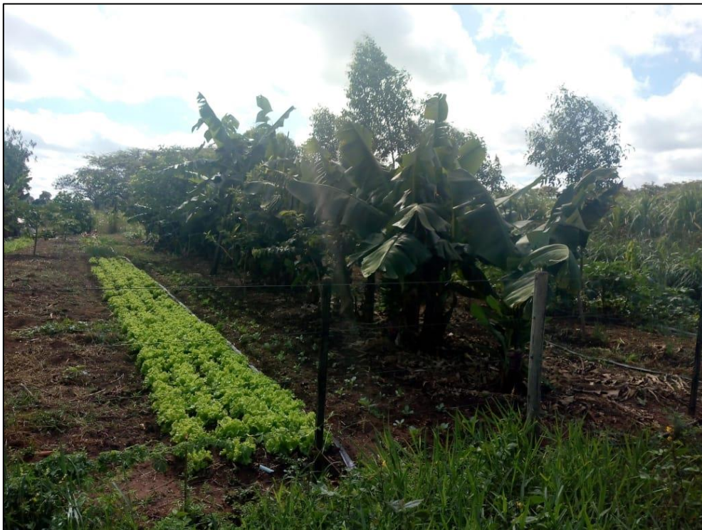
Figura 4 – Imagem da horta orgânica e de algumas espécies fornecidas pela Suzano aos entrevistados